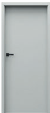
TRIM SOFT model P + zárubňa TRIM SIMPLE rozsah A