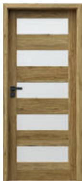
TRIM LITE model B.5 + zárubňa TRIM SIMPLE, rozsah A