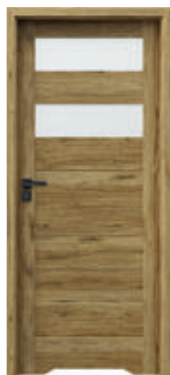
TRIM LITE model B.2 s ventilačným podrezom + zárubňa TRIM SIMPLE rozsah A