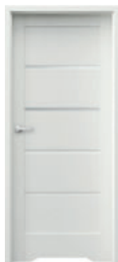
TRIM LITE model A.2 s ventilačným podrezom + zárubňa TRIM SIMPLE, rozsah A