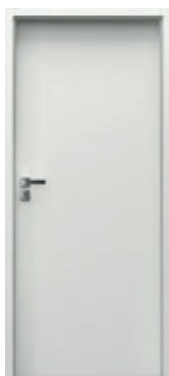
TRIM model T.0 + zárubňa TRIM SIMPLE, rozsah A