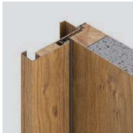
Ocelová zárubňa Thermo