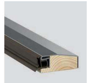
Teplý prah so zvýšenou podporou tepelnej priepustnosti