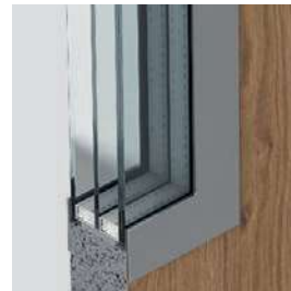
Presklenie - trojskelná sada trieda P4