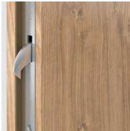
Hák - Horná / dolná závera