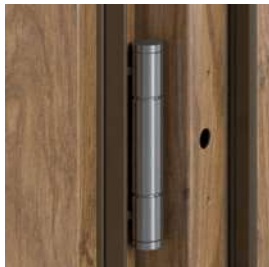
3 trojprvkové závesy