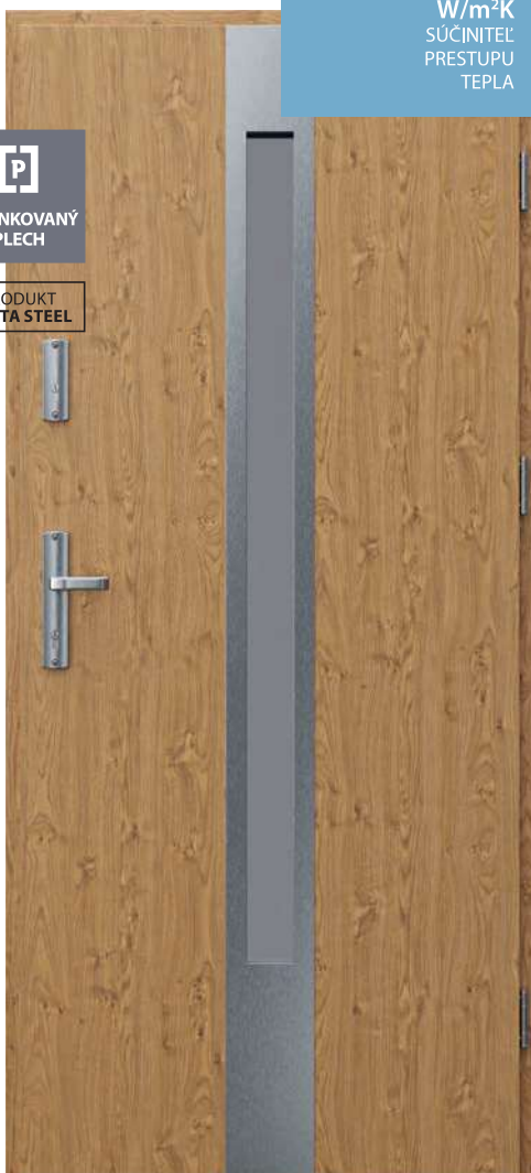
Steel ENERGY PROTECT C.1, Dub Winchester