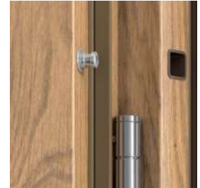
4 bezpečnostné trne proti vysadeniu