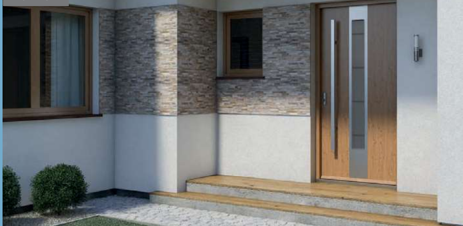
Steel SAFE E.1, Dub Winchester

Bezpečnosť RC2/RC3* Tepelná priepustnosť Ud=1.1÷1.7*