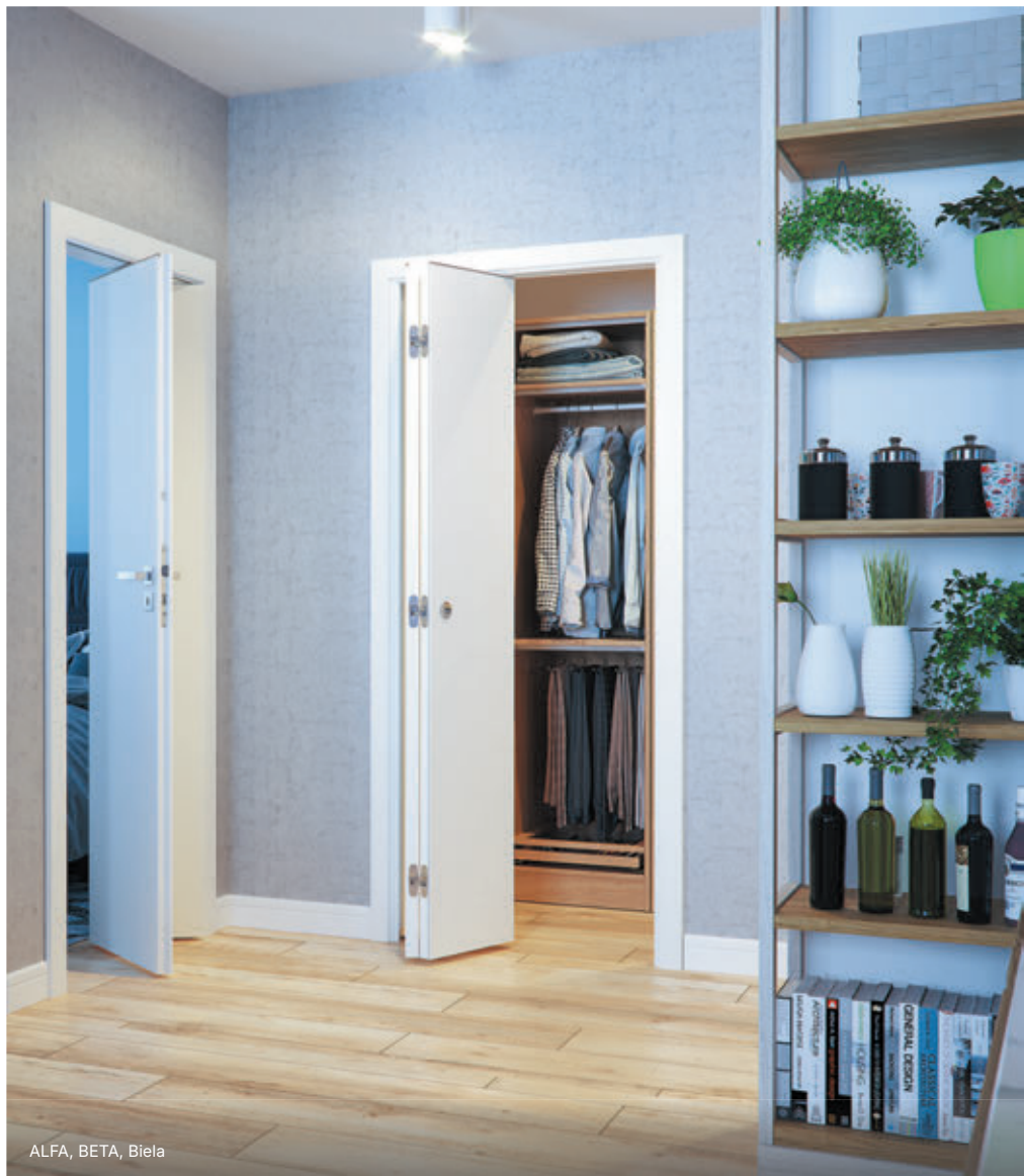
ALFA, BETA, Biela