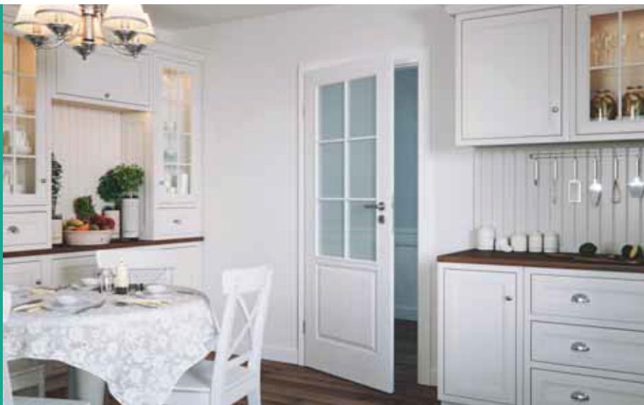
VIEDEŇ B, Biela