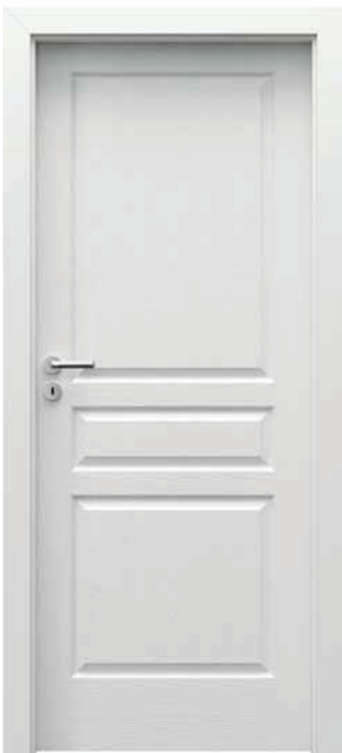
Viedeň P, Biela