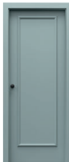
P.2 výška 220