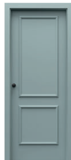
P.3 výška 220