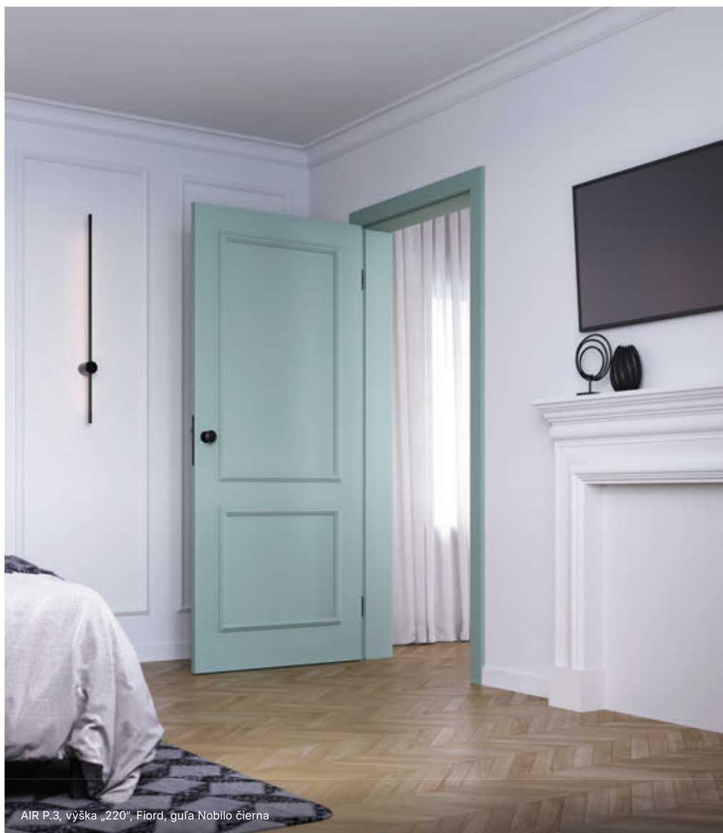
AIR P.3, výška „220“, Fiord, guľa Nobilo čierna